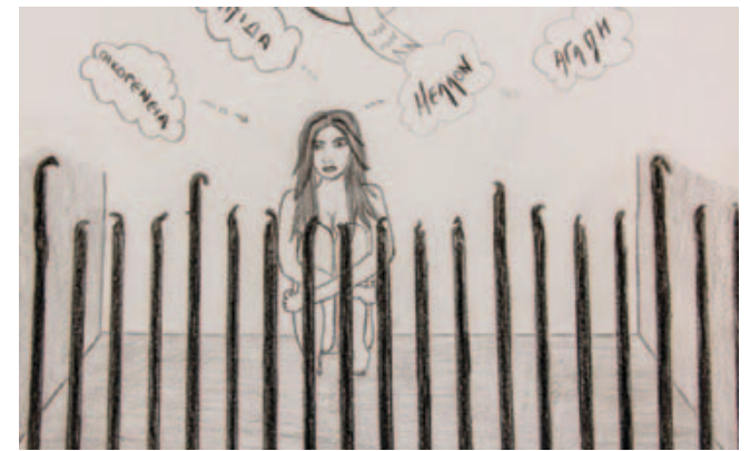
Η έκθεση «ΘΗΒΑ χλμ.102» ανοίγει τις πύλες της στις 24 Φεβρουαρίου στον πολιτιστικό χώρο Ρομάντσο.

Το ευρωπαϊκό πρόγραμμα τέχνης «PAROL - writing and art beyond borders, beyond walls» (Πρόγραμμα γραφής και τέχνης πέρα από σύνορα και τοίχους), το οποίο εφαρμόστηκε ταυτόχρονα σε 5 ευρωπαϊκές χώρες, συνδέει τον εγκλεισμό με την τέχνη και την κοινωνία. Κρατούμενοι από 14 φυλακές σε Βέλγιο, Ελλάδα, Ιταλία, Πολωνία και Σερβία από τον Σεπτέμβριο του 2013 μέχρι και σήμερα συνεργάστηκαν με συγγραφείς, μουσικούς, θεραπευτές, εικαστικούς και θεατρολόγους σε πολυάριθμα εργαστήρια, με σκοπό τη δημιουργία καλλιτεχνικών έργων, τα